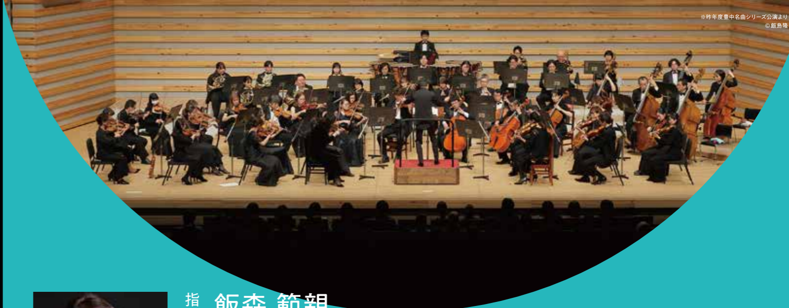
※昨年度豊中名曲シリーズ公演より

テーマに基づく年4回の公演を、書き下ろしのストーリーや独自の要素と共に展開している豊中名曲シリーズ。今年度は、日本の文学や芸術などに古くから表されてきた「花鳥風月」のそれぞれの語をキーワードに取り上げます。新たな章の始まり「風」の回となる今回は、長きにわたり日本センチュリー交響楽団を牽引してきた指揮者・飯森範親と、浜松国際ピアノコンクールで日本人初優勝を果たした期待の新鋭・鈴木愛美が登場します。自然の情景や心情の刻々とした変化、その移ろいを描き出す音楽の豊かな味わいにご期待ください。