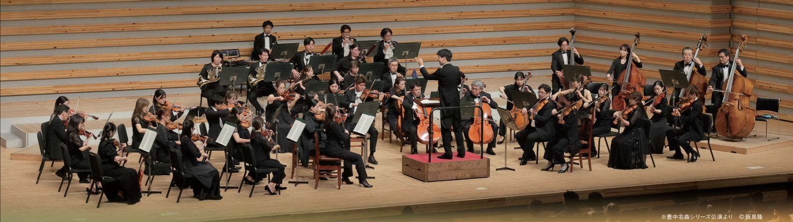
※豊中名曲シリーズ公演より